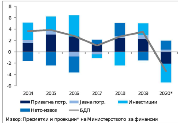
Графикон 1. Придонес во економскиот раст по компоненти (процентни поени)

Согласно ваквите предвидувања, економската активност се очекува да забележи пад од 3,4% во 2020 година. Ефектите од корона кризата врз економијата, согласно основното сценарио, се очекува да бидат најголеми во вториот квартал од годината. Во третиот квартал се предвидува забавување на контракцијата на економската активност, додека во четвртиот квартал се очекува постепено закрепнување на економијата.