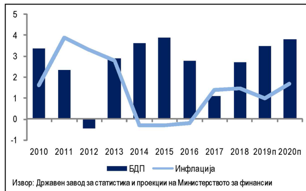
Графикон 1. Реална стапка на раст на БДП и стапка на инфлација

Бруто-инвестициите во 2020 година е предвидено да се зголемат за 8,0% на реална основа. Позитивен придонес врз растот на инвестициите се очекува да имаат планираните инвестиции на јавниот сектор, како и континуираната поддршката на инвестициската активност на домашните и странските претпријатија. Основни предуслови за постигнување на проектираниот раст на инвестициите се задржување на политичката стабилност во земјата и на довербата на економските субјекти. Притоа, напорите за континуирано подобрување на деловната клима и на патната инфраструктура се значајни фактори за одржлив раст на инвестициите.